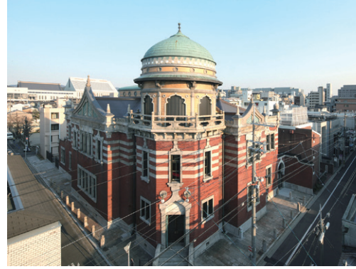
本願寺伝道院 | Hongwanji Dendoin

The exhibition introduces a wide range of works related to time, starting with works that evoke a universal concept of time, through to works exploring “memory” as something experienced individually, to “history” representing cultural phenomenon, as well as “traces” of time held by objects. By considering time not only in the usual manner as something relative, but also as something infinite that is beyond comprehensive, yet something finite that is within each of us, the exhibition asks how we can respect one another and coexist in the time — limited and impartial — we are living today.